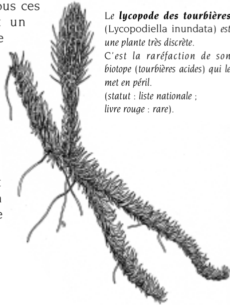
Le lycopode des tourbières ( Lycopodiella inundata ) est une plante très discrète. C'est la raréfaction de son biotope (tourbières acides) qui le met en péril. (statut : liste nationale ; livre rouge : rare).

Parce que les plantes sont la base de la vie, il est de notre devoir de préserver la diversité biologique de ce patrimoine, de le transmettre aux générations futures. Chaque plante recèle de potentiels aliments, médicaments, souches de résistances aux maladies des cultures... À tous ces titres, elles sont un véritable puits de richesses patrimoniales et économiques. Enfin, protéger les plantes, c'est protéger les écosystèmes. Pour toutes ces raisons, les plantes sont indispensables à l'avenir de l'humanité.