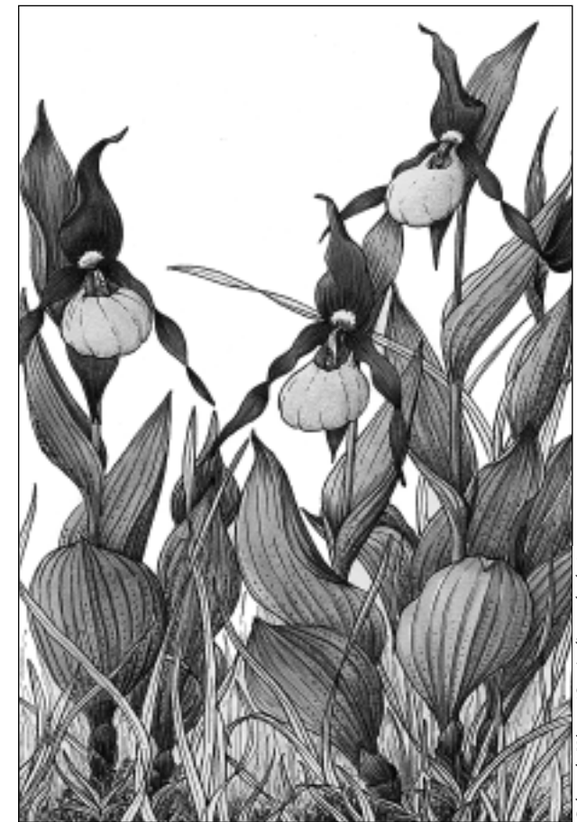
Sabot de Vénus ( Cypripedium calceolus )

Les forêts tropicales ne sont pas les seules régions touchées par le fléau de la chute de diversité biologique. En France aussi des espèces ont disparu ; d'autres sont au bord de l'extinction.