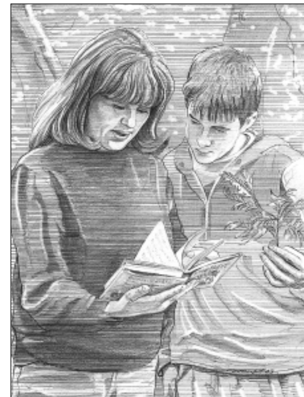
Dessins : J-C Campet (sauf capitule : L. Bellion)

La botanique souffre d'une image un peu désuète, ardue et compliquée. Ces quelques conseils devraient vous permettre de surmonter, tout en douceur, les obstacles décourageant souvent les meilleures volontés et pénétrer ainsi dans l'univers passionnant du monde végétal.